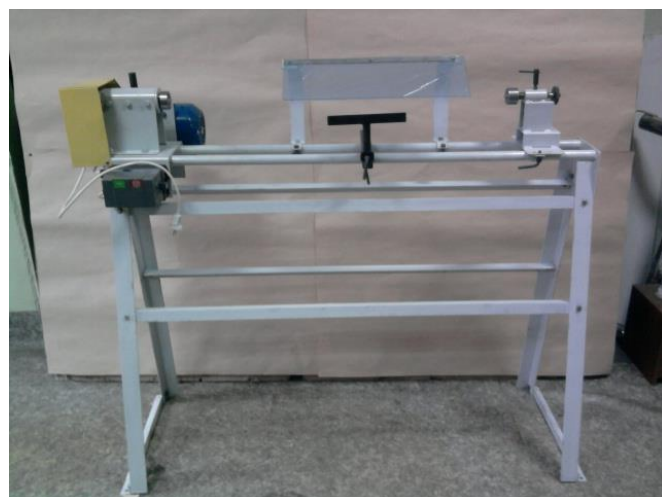
Токарный станок ДОС-Т1000 (напольное исполнение)