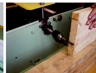
Сверление, долбление, пазование