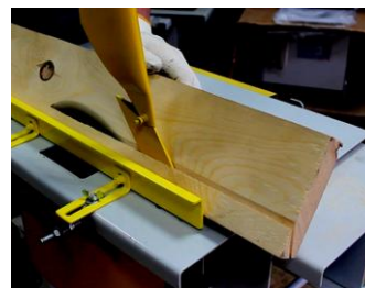
Пиление продольное под углом с Угловой линейкой