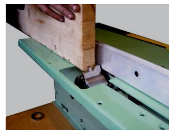
Горизонтальное фасонное фрезерование