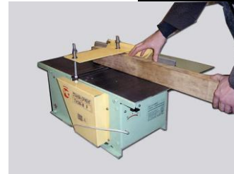
Стругание с прижимом