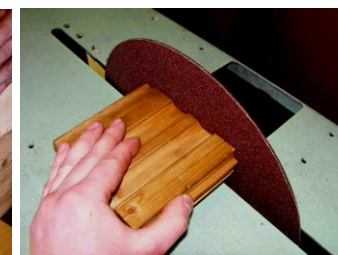
Шлифование, Разрезка металла и пластмасс, заточка инструмента