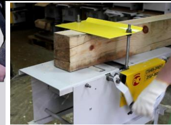
Рейсмусование с механической подачей