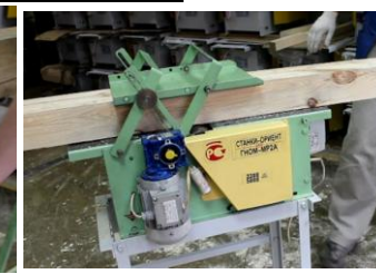
Рейсмусование с автоматической подачей и УБР